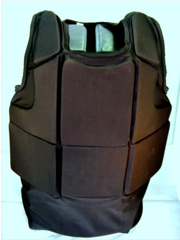
ボディプロテクター