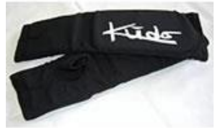
アームプロテクター