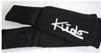
レグプロテクター